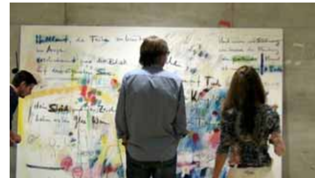
Videostills aus dem Video von Stephan Lichtensteiger